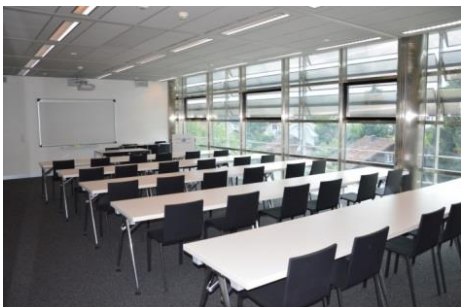
Salle en bancs d'école : 30 places